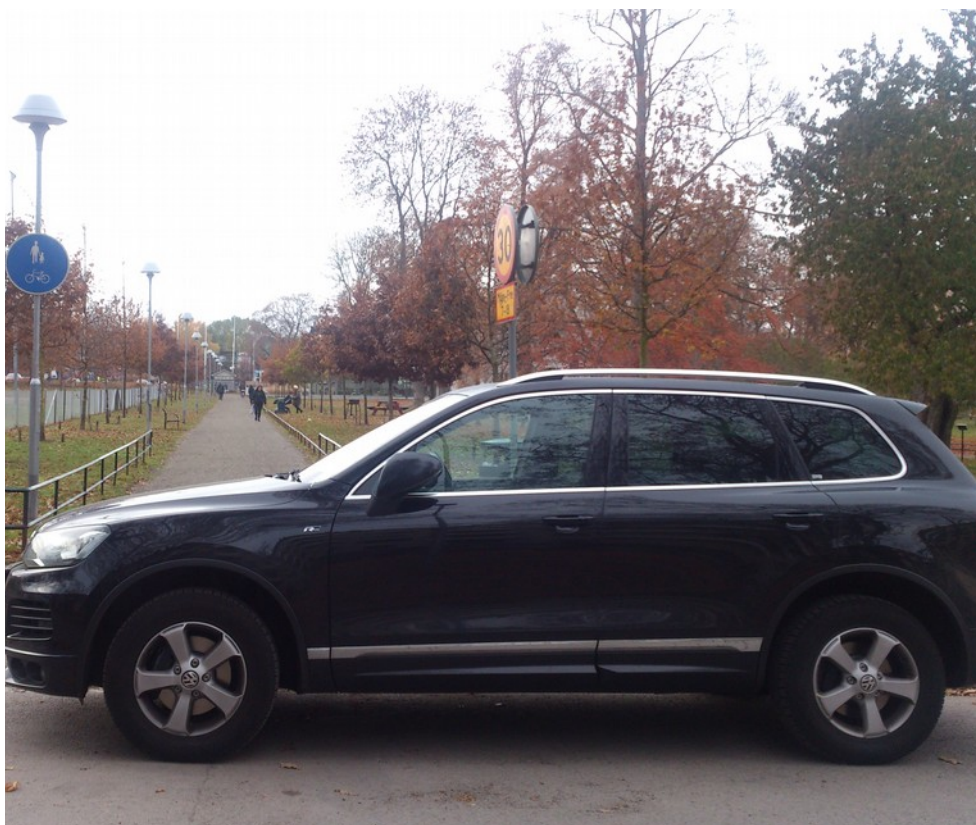
Illustration 2: Korsning blockerad av parkerad bil