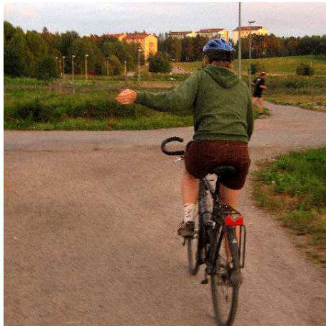
Armen rakt åt vänster när du ska vänster

För att tala om hur du tänker cykla ska du ge tecken till andra. De fungerar precis som blinkers och bromsljus på bilar.