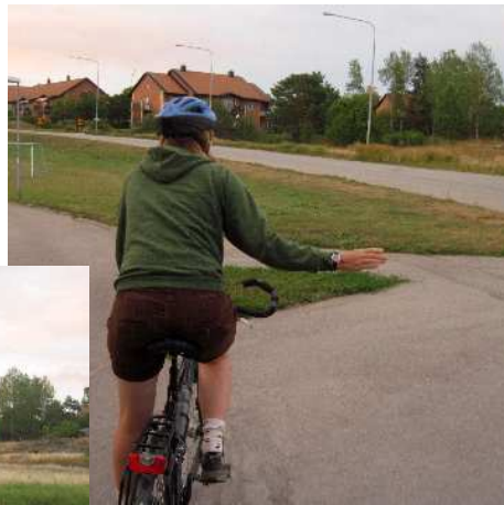
Armen rakt åt höger när du ska höger