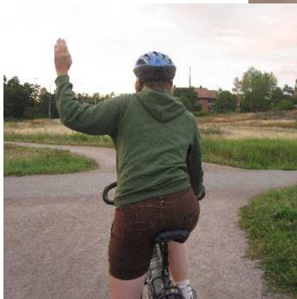
Armen rakt uppåt innan du bromsar