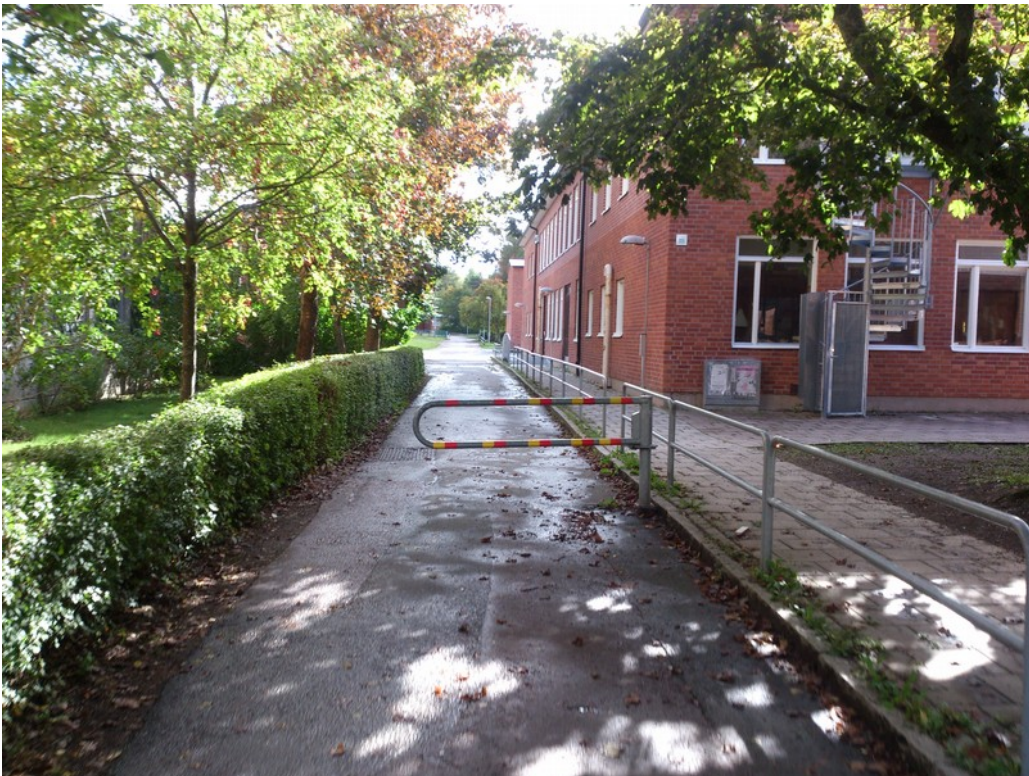
Illustration 3: Hinder närmast Granitvägen