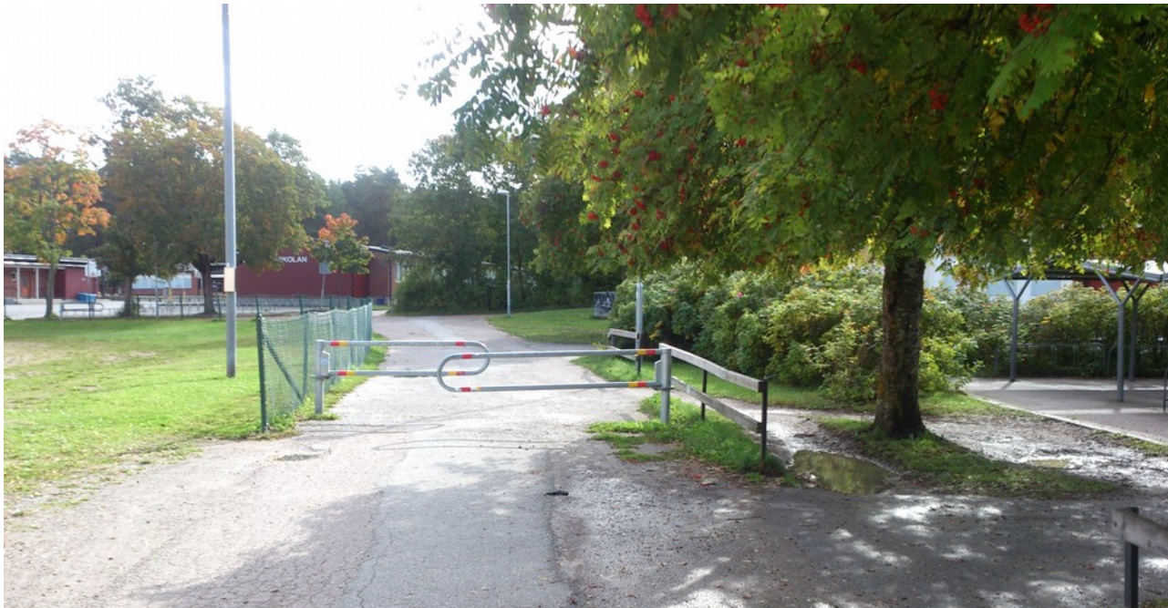
Illustration 1: Hinder utanför Eriksbergsskolan. Observera kringfarten till höger Problem:

Gång- och cykelvägen mellan Granitvägen och Norby har hinder för biltrafik, som också hindrar cykeltrafik. Alla hinder ger onödig begränsning i framkomlighet. Dubbelgrindarna är särskilt problematiska, och gör dessutom att lastcykel eller cykel med släp i många fall inte kan komma igenom alls. Vid Eriksbergsskolans stora cykelparkering finns dock en informell förbifart.