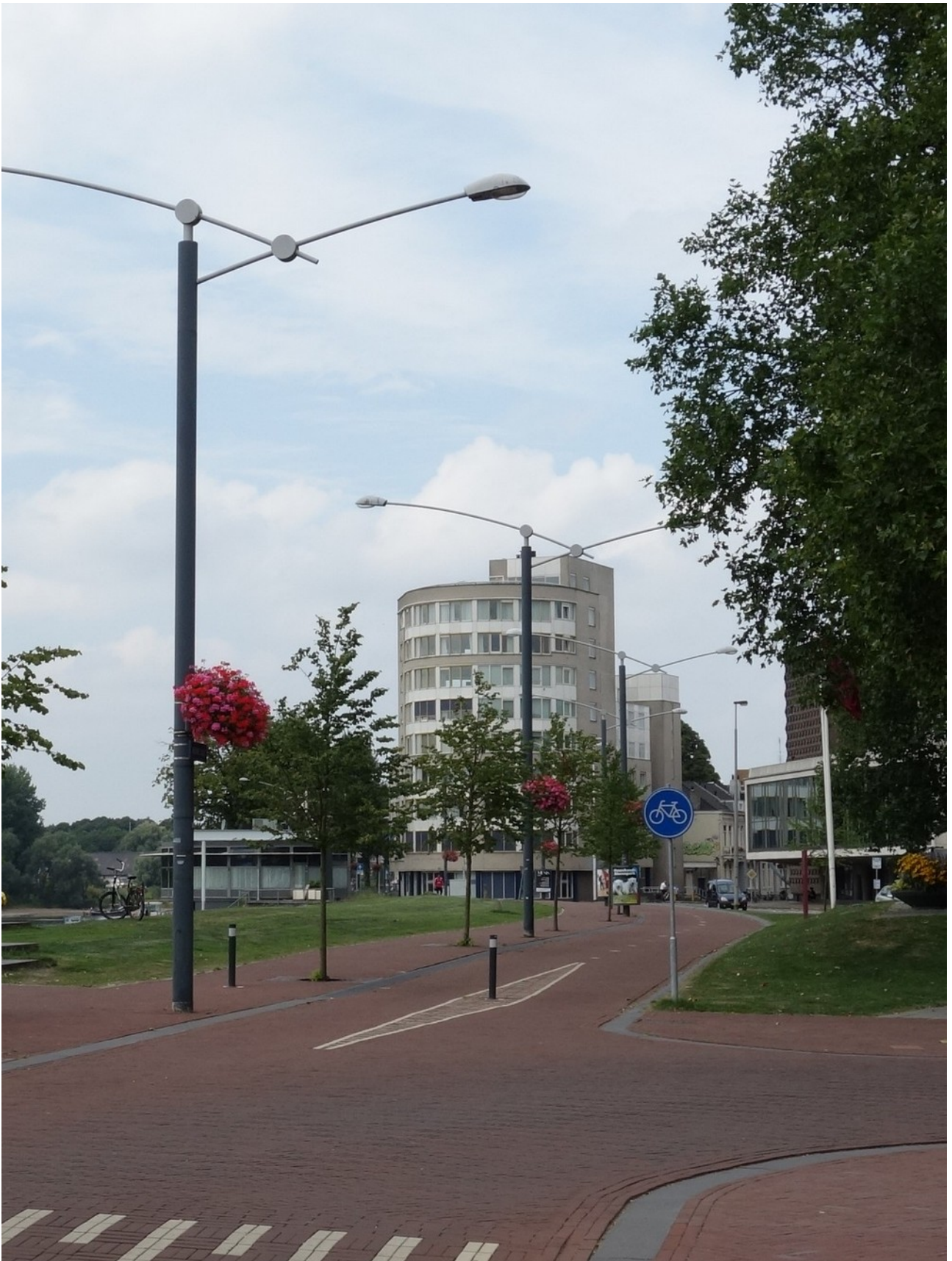
Illustration 4: Cykelvänliga bilhinder (Arnhem, Nederländerna)