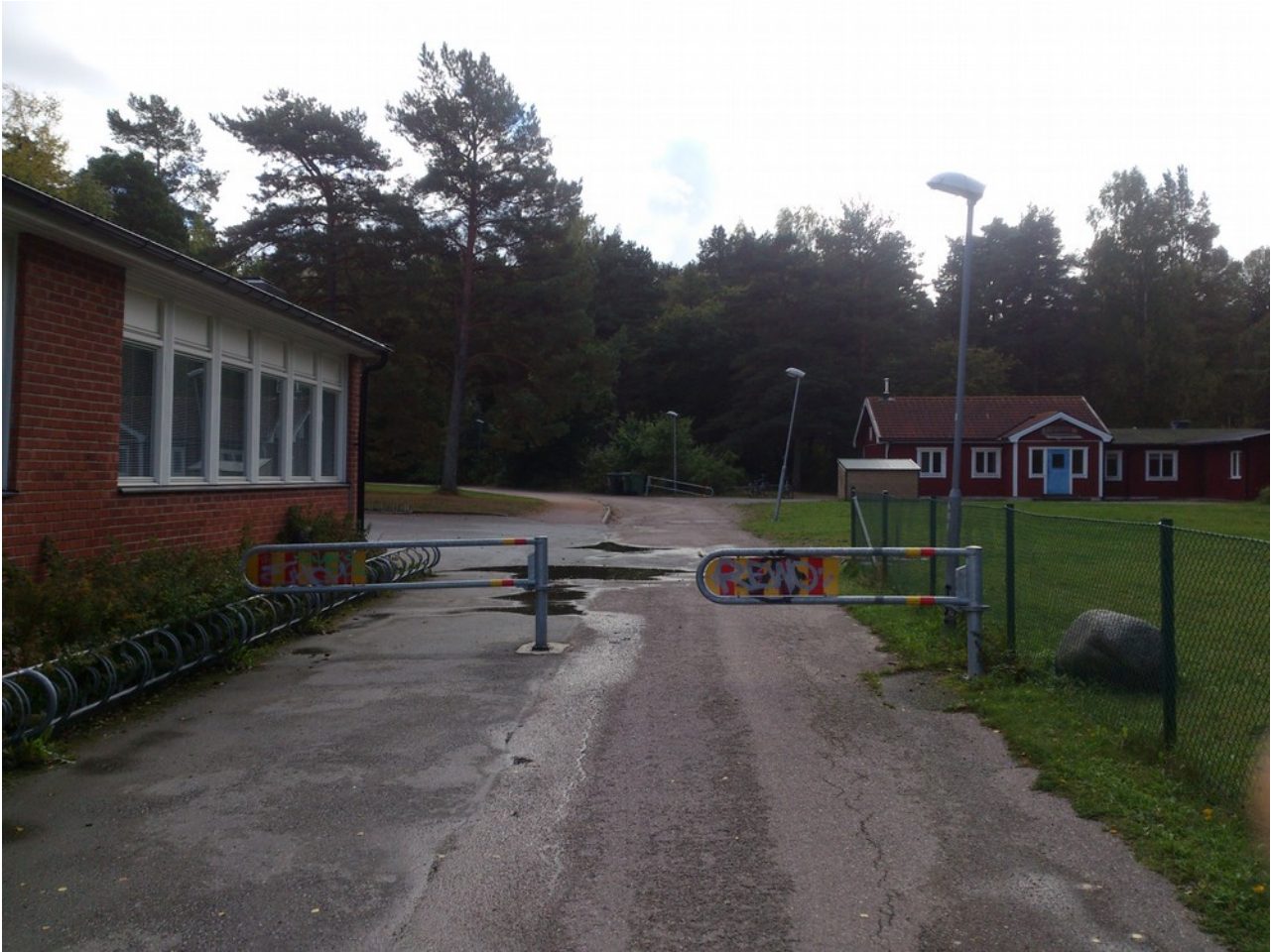
Illustration 2: Hinder vid Hågadalskolan