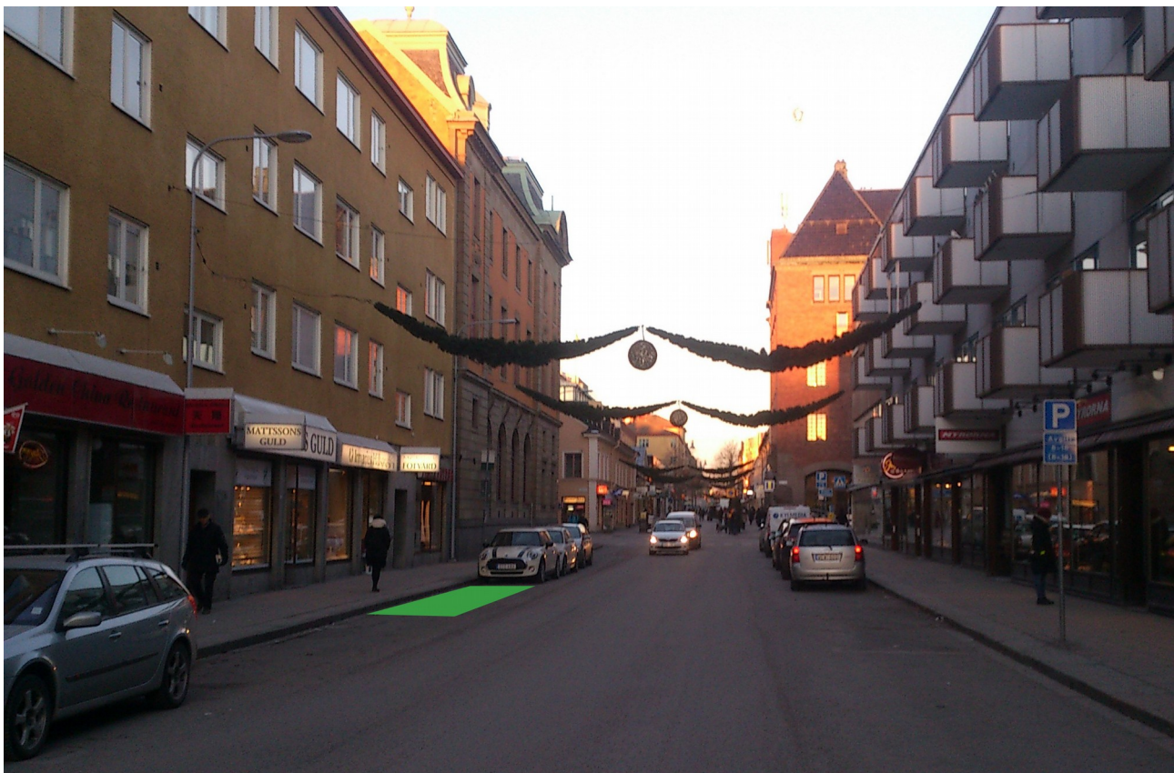
Illustration 1: Förslag på placering av cykelparkering