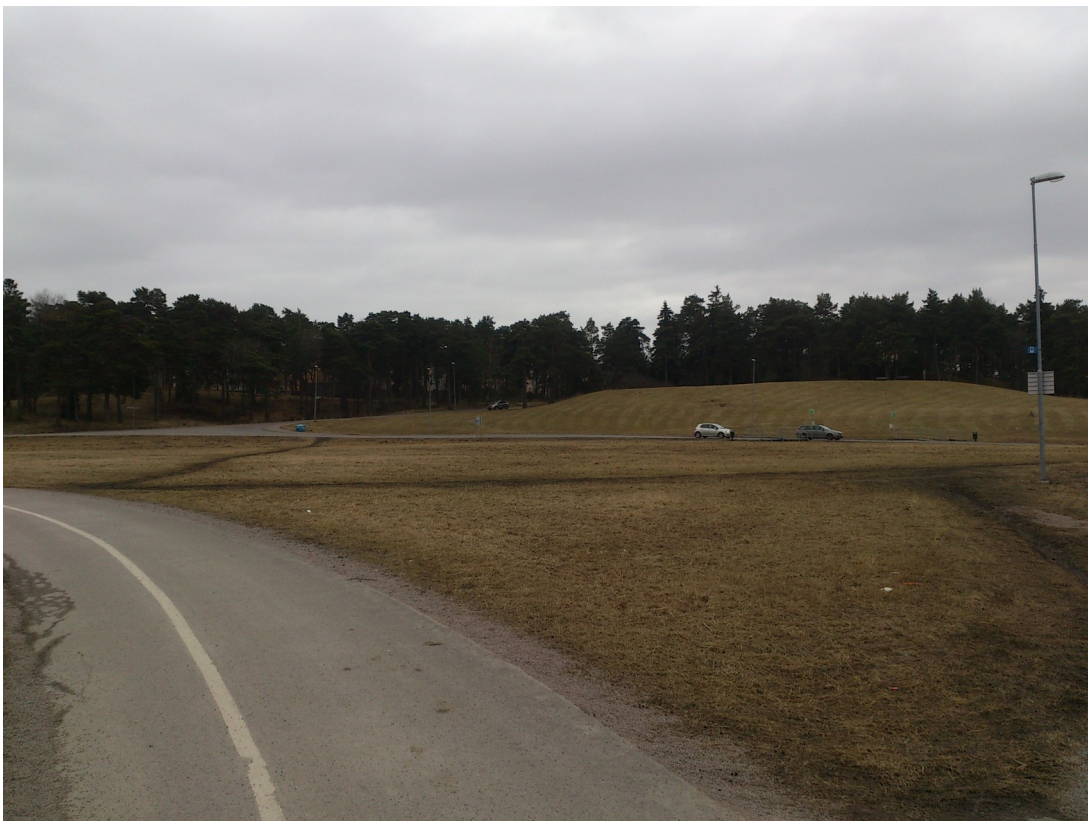
Illustration 2: stigar i förslagets relationer, plus en mot Granitvägen