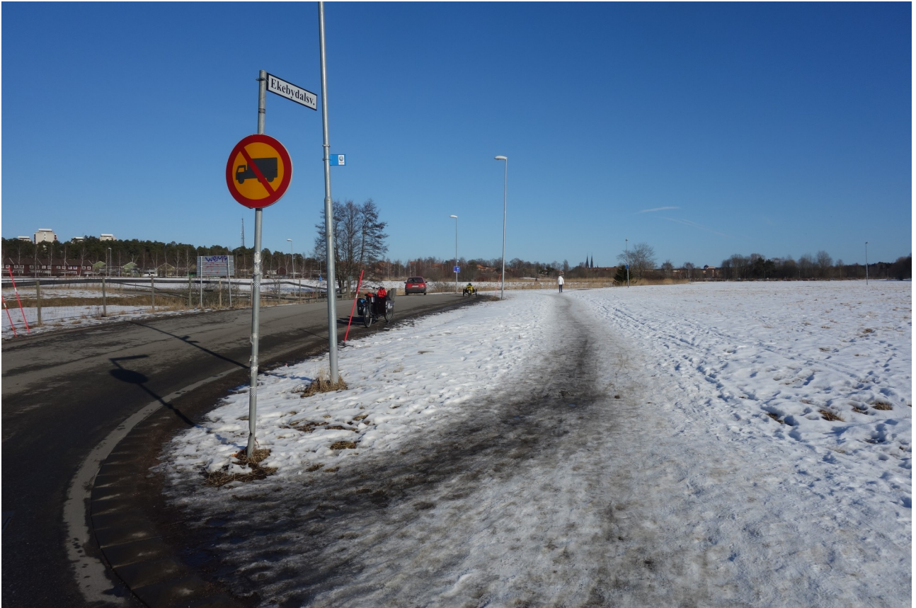
Illustration 1: desire line / informell GC-vinterväg längs Ekebydalsvägen